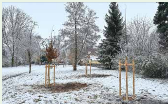
Drei neu gepflanzte Jubiläumsbäume im Mölbiser "Bürgerpark"