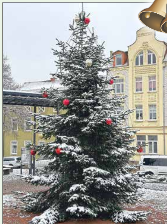
Weihnachtsbaum auf dem Markt in Rötha