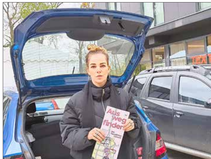
Verteilung der Plakate im Landkreis Leipzig.

Die Vereinsmitglieder, Mitarbeiterinnen und Mitarbeiter stehen für Selbstbestimmung, Chancengleichheit und Gewaltfreiheit für Frauen, Männer, Kinder und Familien.